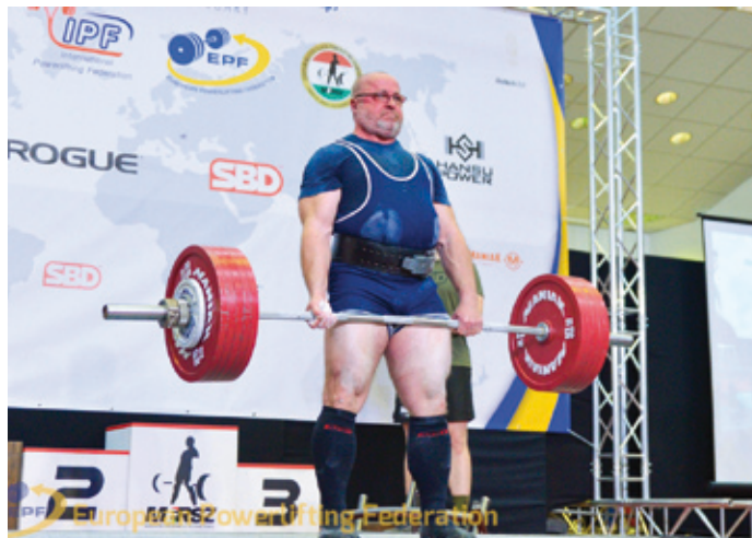
Ryszard Wszola