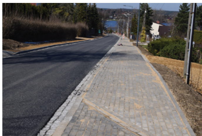
Na ulicy Radosnej przebudowano drogę oraz wybudowano chodnik.