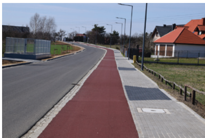
Nowo wybudowana ścieżka rowerowa na ulicy Szerokiej w Tuliszwowie.