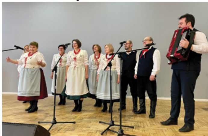
Zespół Śpiewaczy Koła Gospodyń Wiejskich w Leśniakach. Na zakończenie spotkania dla publiczności wystąpił Zespół Śpiewaczy Koła Gospodyń Wiejskich w Leśniakach.