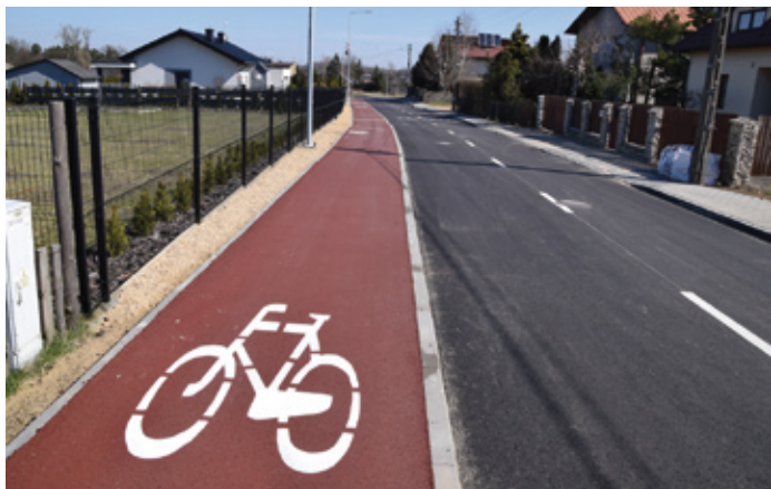
Zakres zadania obejmował m.in. budowę ścieżki rowerowej oraz chodnika.

Wydział Rozwoju, Inwestycji, Funduszy i Zamówień Publicznych