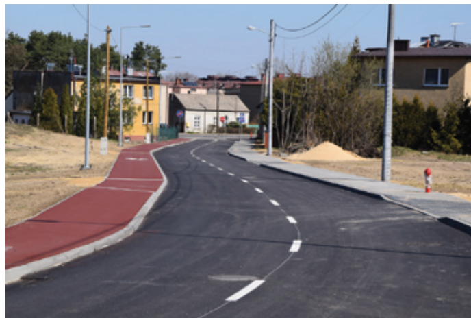
Ulica Chabrowa po wykonaniu inwestycji.

Wykonano także wycinkę kolidujących drzew oraz prace wykończeniowe i porządkowe na terenie inwestycji.