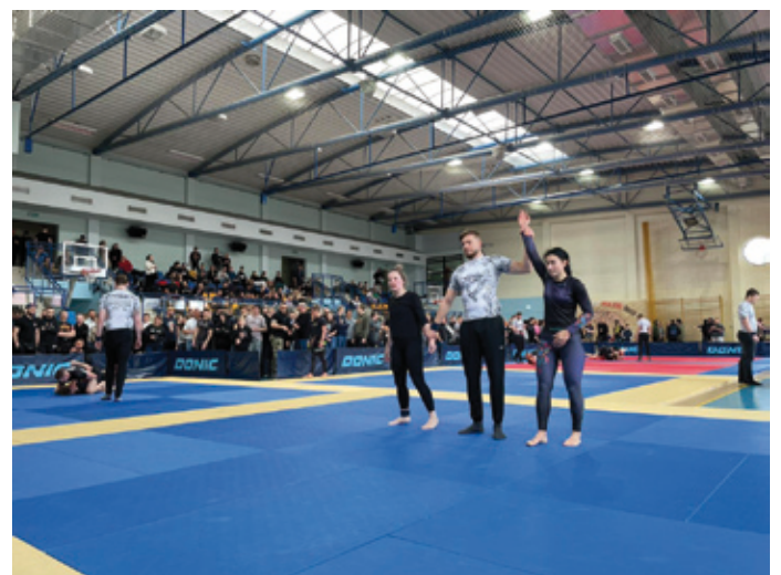
Miejscem zawodów po raz kolejny była hala sportowa w Siewierzu.