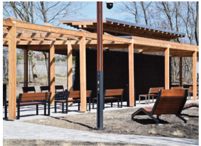
Teźnia solankowa w Parku Miejskim w Siewierzu będzie czynna codziennie w godzinach od 09.00 do 19.00 w okresie od kwietnia do października.