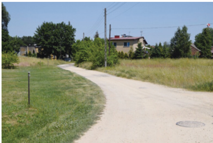
Ulica Chabrowa przed wykonaniem inwestycji.

Zakończyła się realizacja inwestycji polegającej na budowie drogi gminnej na ulicy Chabrowej w Siewierzu. Wykonawcą zadania była firma „DOMAX” z siedzibą w Boronowie.