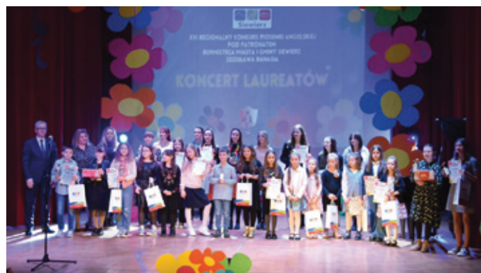
Laureaci XVI Regionalnego Konkursu Piosenki Angielskiej.