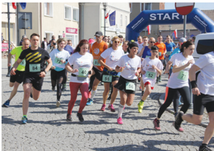
Start i meta biegu oraz marszu zostały ulokowane na Rynku w Siewierzu.

Zeskanuj kod i zapisz się na bieg lub marsz Nordic Walking.