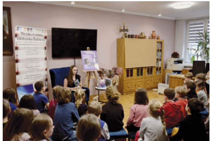
W spotkaniu uczestniczyli uczniowie Szkoły Podstawowej nr 1 w Siewierzu.

Pisarka w swoich książkach wykorzystuje elementy zaczerpnięte z wierzeń słowiańskich, co nadaje im oryginalności i pobu-