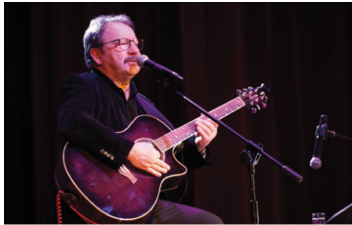
Zbigniew Zamachowski wystąpił dla siewierskiej publiczności z okazji Dnia Kobiet.

Miejsko-Gminne Centrum Kultury Sportu i Turystyki w Siewierzu