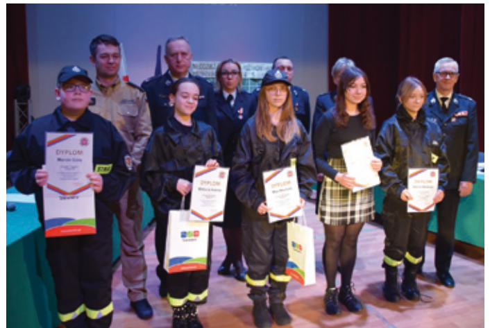
Najlepsi uczestnicy gminnych eliminacji OTWP w II grupie wiekowej.

wo uczestnictwa w rozgrywkach na szczeblu powiatowym, które odbędą się również w Siewierzu w dniu 12 kwietnia br.