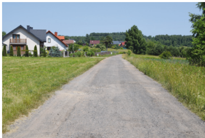
Ulica Szeroka przed wykonaniem inwestycji.

Wydział Rozwoju, Inwestycji, Funduszy i Zamówień Publicznych