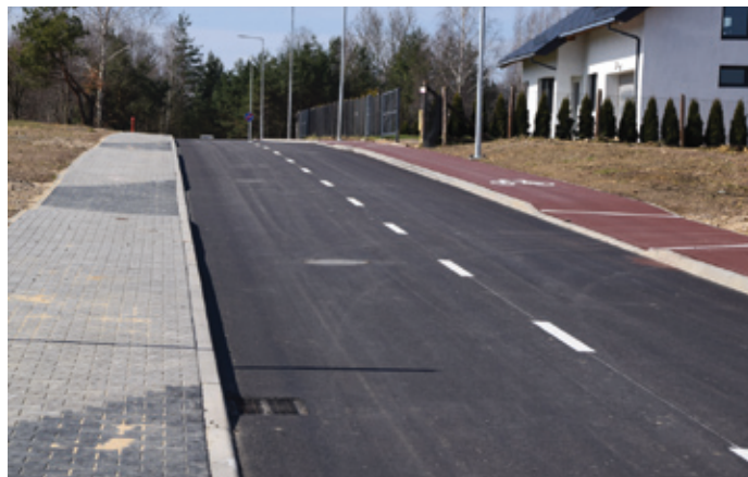
Rozbudowie uległa sieć elektroenergetyczna, gazowa, wodociągowa i kanalizacyjna.