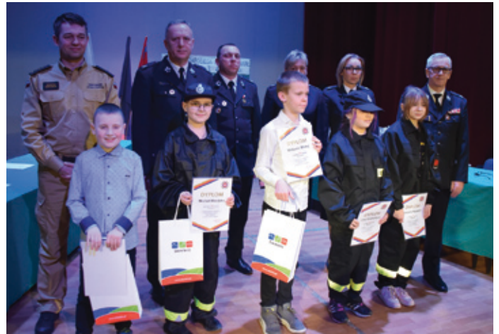
Najlepsi uczestnicy gminnych eliminacji OTWP w I grupie wiekowej.