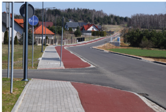
Ulica Szeroka po wykonaniu inwestycji.