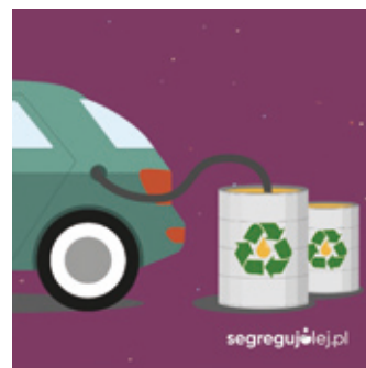
Zużyty olej z recyklingu jest wykorzystywany do produkcji biopaliwa.