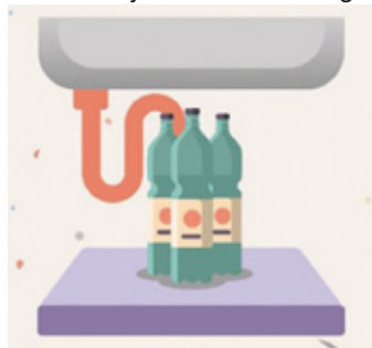
Segregacja oleju to brak awarii systemu kanalizacyjnego.