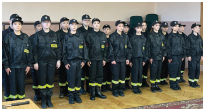
Członkowie Młodzieżowej Drużyny Pożarniczej z Żelisławic.

Zeskanuj kod i zobacz relację wideo z wydarzenia.