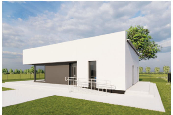
Wizualizacja przedstawiająca budynek świetlicy wiejskiej w Warężynie.

Na realizację zadania Gmina uzyskała dofinansowanie ze środków dotacji celowej Górnośląsko-Zagłębiowskiej Metropolii w ramach Funduszu Odporności w 2023 r. w wysokości 225.687,00 zł. Dodatkowo Gmina złożyła wniosek o przyznanie pomocy