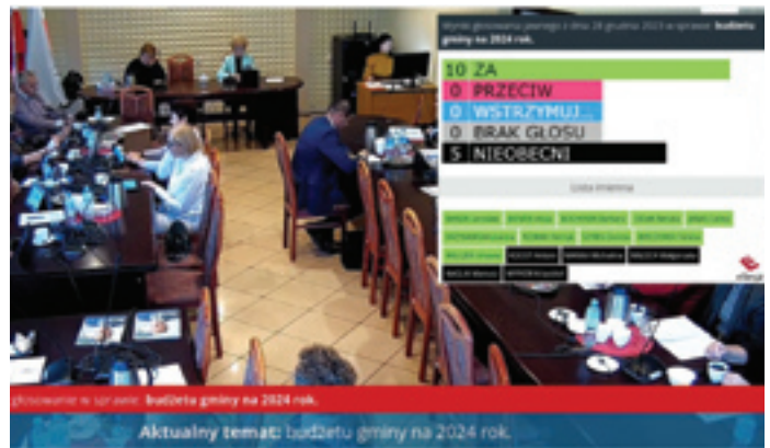
Przebieganie w sali sejm. Budżetu gminy na 2024 rok.