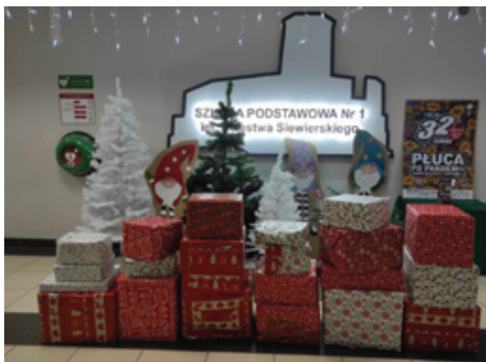
Paczki przygotowane przez społeczność Szkoły Podstawowej Nr 1 w Siewierzu.