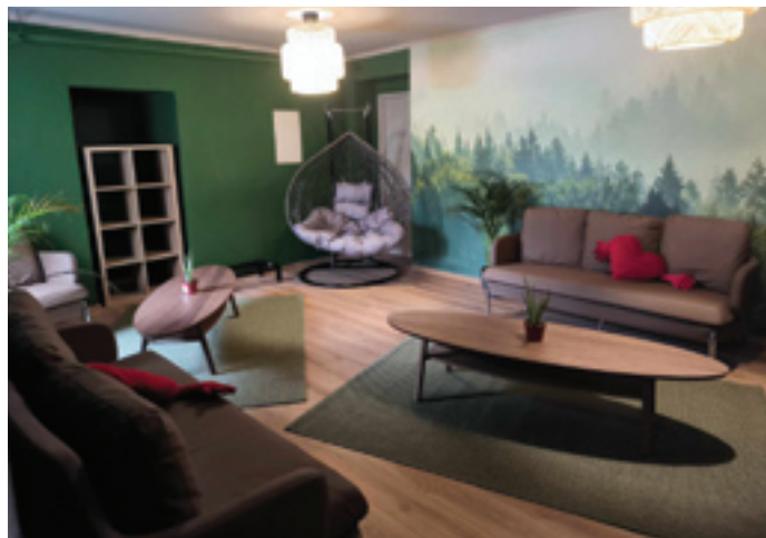
Sala wyciszenia i relaksu w Zespole Szkół Ogólnokształcących i Technicznych.