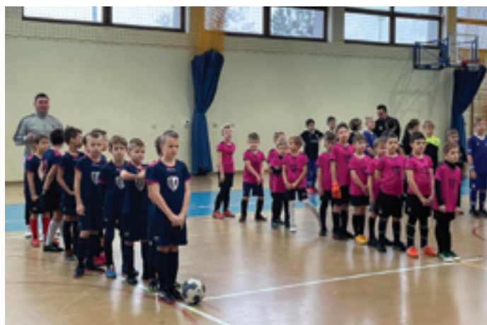
Podopieczni Akademii Piłkarskiej Młoda Przemsha.

Po zakończeniu zawodów wszyscy uczestnicy zostali uhonorowani pamiątkowymi medalami, natomiast najlepsze drużyny otrzymały dodatkowe wyróżnienia w postaci okolicznościowych