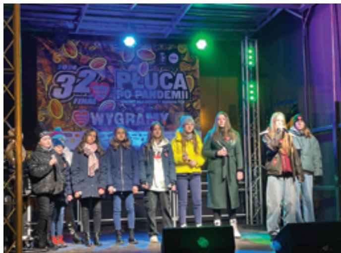
Podczas siewierskiego finału WOŚP na Rynku wystąpił m.in. zespół Encanto.