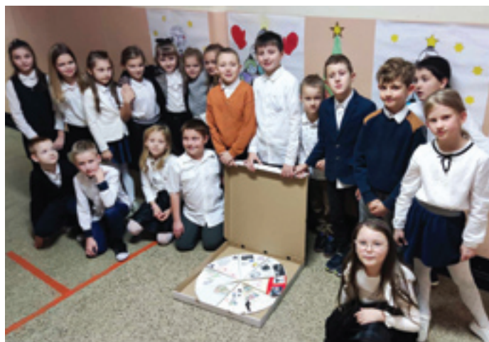
Uczniowie uczestniczyli w niecodziennych obchodach jubileuszu szkoły.