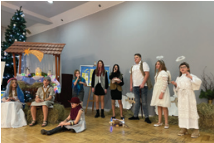
W świąteczny nastrój wprowadził zgromadzonych występ dzieci i młodzieży - podopiecznych Ośrodka Wspierania Dziecka i Rodziny.