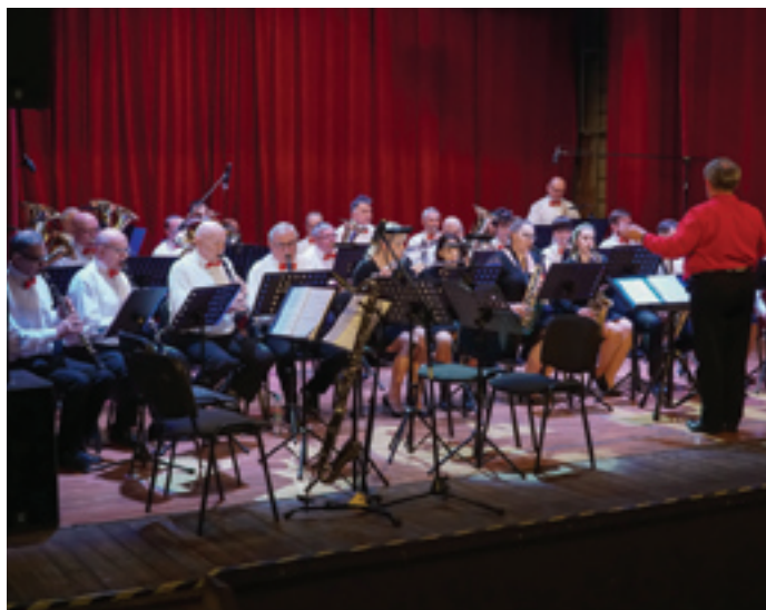
Orkiestra Reprezentacyjna Miasta i Gminy Siewierz.