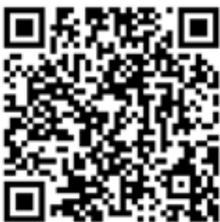
Zeskanuj kod i zobacz relację wideo z wydarzenia.