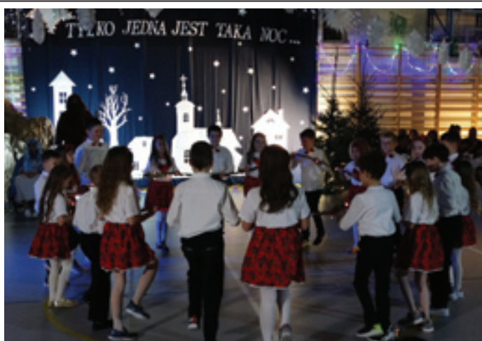
Przedstawienie jasełkowe w Szkole Podstawowej Nr 2 w Siewierzu.