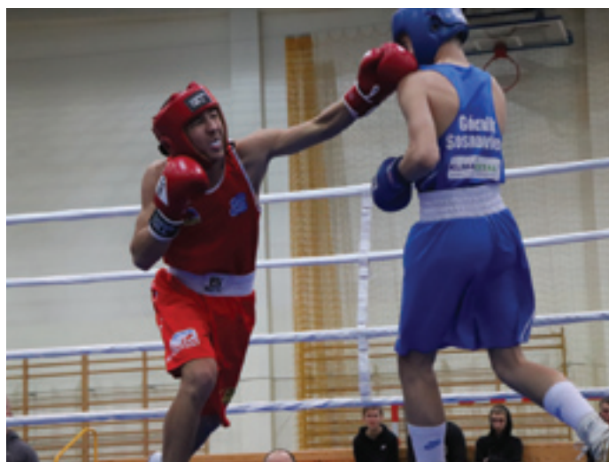
Publiczność na hali sportowej w Siewierzu zobaczyła prawie 30 pojedynków.

Boks to widowiskowy sport, który przyciąga wielu fanów. Zawodnicy cechują się nie tylko imponującą sylwetką, ale przede wszystkim zwinnością, szybkością ruchów i niebywałą