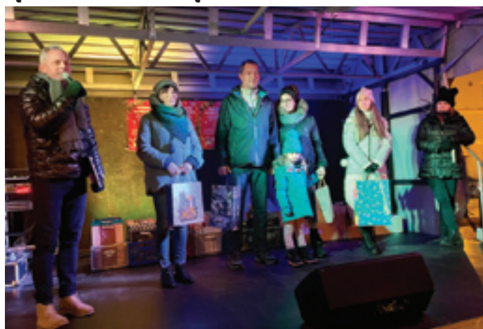
Laureaci konkursu w kategorii dorośli.