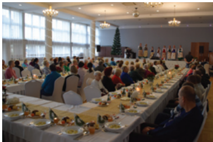
Dla zgromadzonych wystąpili uczniowie Szkoły Podstawowej Nr 1 w Siewierzu.

Przed rozpoczęciem wigilijnego posiłku wszyscy uczestnicy złożyli sobie serdeczne życzenia, dzieląc się opłatkiem, wy-