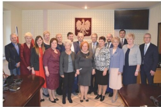
Burmistrz Miasta i Gminy Siewierz wraz z Radnymi Rady Miejskiej VIII kadencji.

W bieżącym numerze Kuriera Siewierskiego została podsumowana dotychczasowa praca Rady Miejskiej w Siewierzu VIII kadencji oraz Burmistrza Miasta i Gminy Siewierz - w formie sprawozdania z realizacji wybranych zadań oraz najważniejszych inwestycji przeprowadzonych przez Urząd Miasta i Gminy Siewierz w latach 2019-2021.