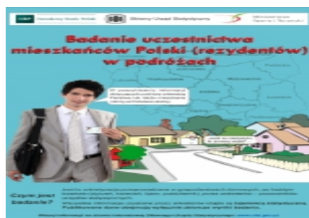
Plakat 1 - Badanie - Uczestnictwo mieszkańców Polski (rezydentów) w podróżach

| PDF | 145.44 KB | 2017-07-04 09:05:01 |